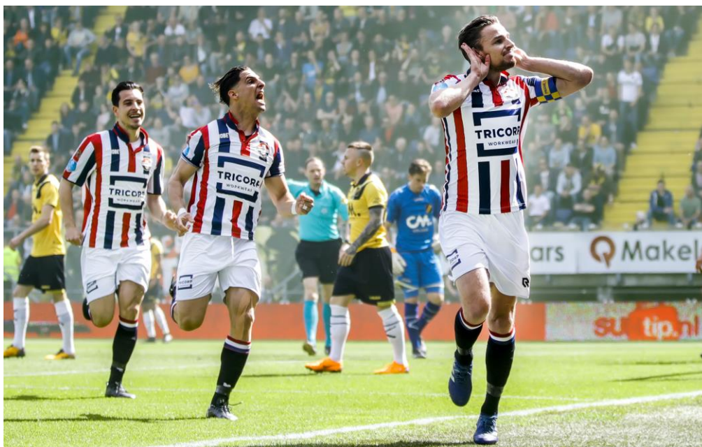
In Breda werd afgelopen seizoen de derby tegen NAC Breda met 1-2 gewonnen

De vennootschap maakt gebruik van de consolidatievrijstelling zoals bedoeld in artikel 407 lid 2a Titel 9 BW 2.