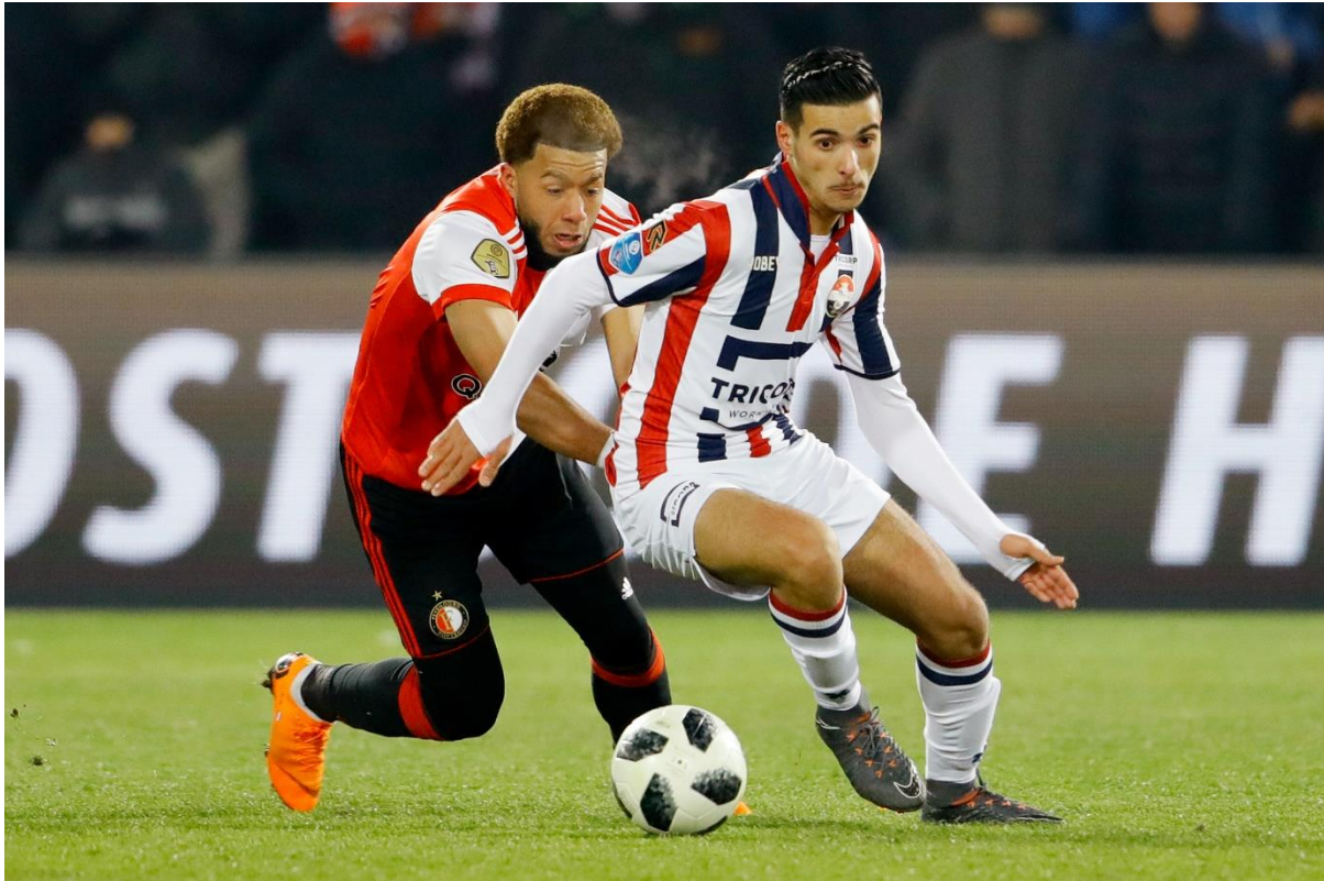
Feyenoord bleek in de halve finale van het bekertoernooi een maatje te groot: 3-0